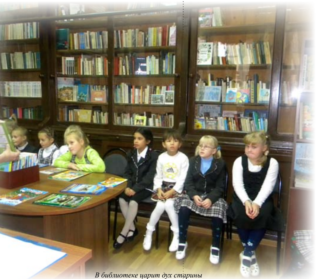
В библиотеке царит дух старины

– Видите здание напротив нашей школы? – спрашивает ди-