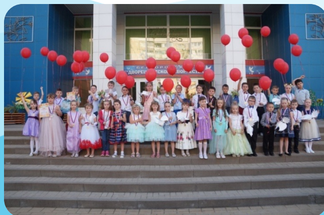
«Подготовка к школе»