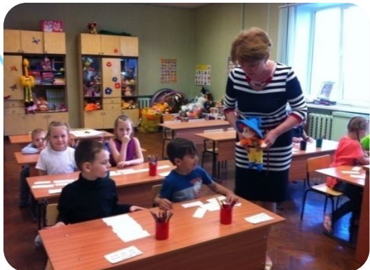
«Академия для самых маленьких»