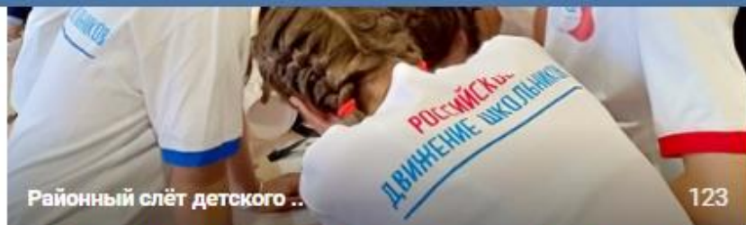
Районный слёт детского ..